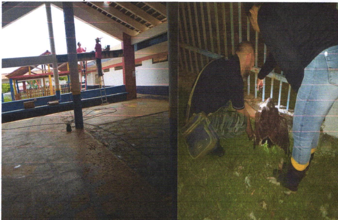
Trabalho de limpeza em andamento.